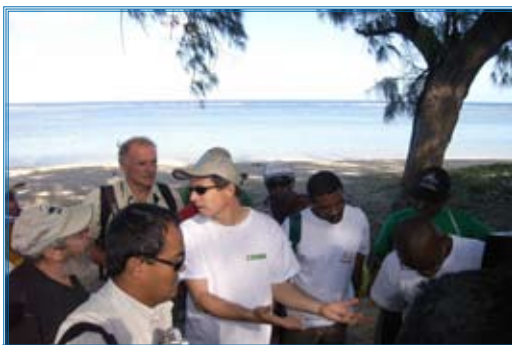
Visite de la Réserve Naturelle Nationale Marine France Réunion - 2009

Pour plus d'informations, visiter le site web www.wio-compas.org .