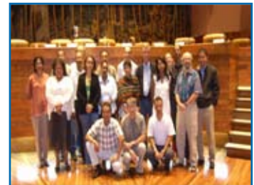
Les participants au COPIL 4 France Réunion - 2009