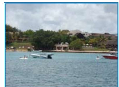
Balaclava Marine Park Maurice - 2008