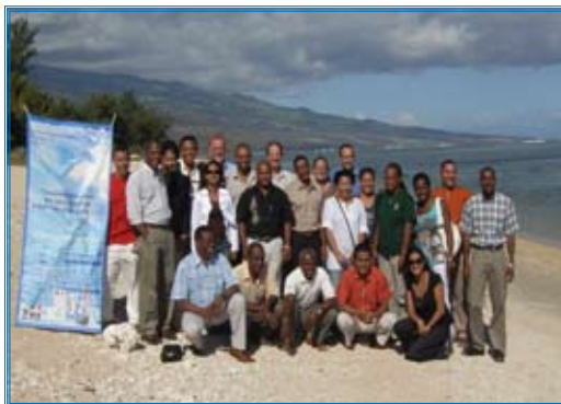
Photo de famille 3 e forum des gestionnaires à La Saline-les-bains France Réunion - 2009

Après les travaux de traduction en français et de design de l'outil de gestion d'AMP pour les gestionnaires sous forme de classeur, la phase d'impression est terminée, il reste les travaux de finition (laminage ; assemblage) qui se font à Maurice. L'aide des autorités dans chaque pays est requise pour le dédouanement de ces classeurs pour ne pas retarder leur distribution.